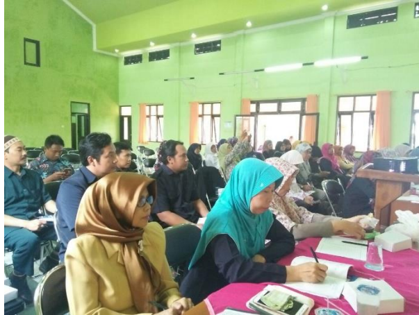
Gambar 2. Pelatihan komprehensif menulis dan menyunting artikel ilmiah pada sesi ceramah.

kalimat, paragraf, dan tanda baca; materi tentang sistematika penulisan karya ilmiah; materi tentang teknik menyunting karya ilmiah yang tepat dan efisien. Sesi ceramah diisi dengan pemberian teori mengenai penulisan artikel ilmiah dari hasil penelitian sesuai dengan gambar 2.