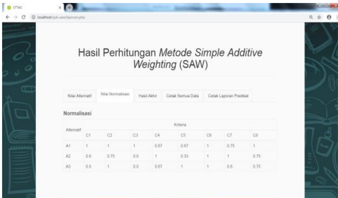
Gambar 3. Tampilan tab nilai normalisasi

Teknosains: Jurnal Sains, Teknologi dan Informatika is licensed under a Creative Commons Attribution-NonCommercial 4.0 International License.