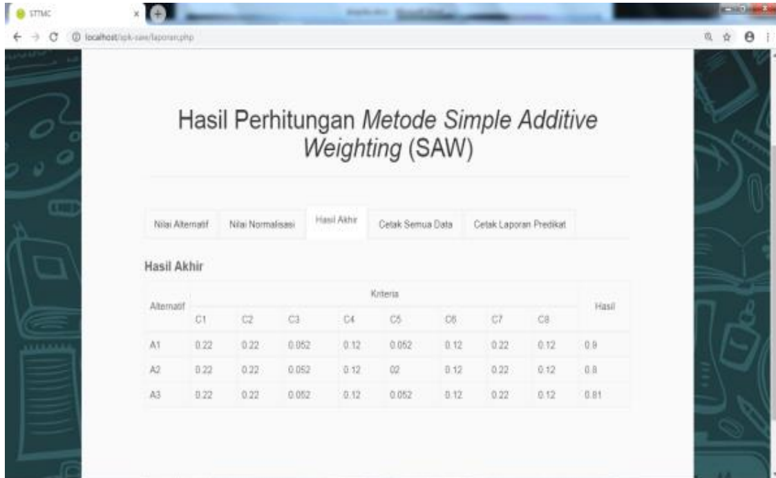
Gambar 4. Tampilan tab hasil akhir

DOI: http://doi.org/10.37373/tekno.v%07i%02.18