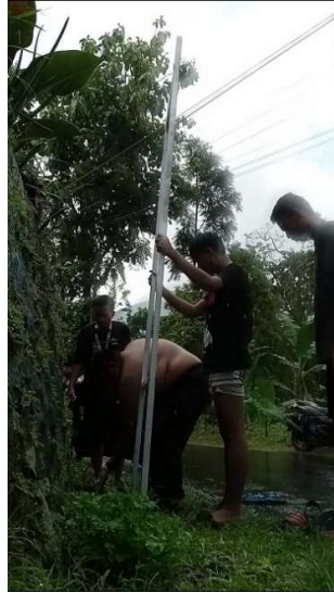
Gambar 4. Proses pemasangan plakat petunjuk arah.

Setelah kegiatan proses penulisan dan pengecatan plakat petunjuk arah mahasiswa kkn-p Umsida Kelompok 31 melakukan kegiatan pemasangan plakat petunjuk arah yang ada di dua titik yaitu SMA 1 Trawas, Dan Perempatan Jaten di Desa Penanggungan Kec.Trawas, Kab.Mojokerto. Pada Gambar 4 menjelaskan Proses pemasangan plakat bertujuan untuk memberikan panduan yang jelas kepada pengunjung atau masyarakat sekitar mengenai arah yang harus diambil untuk mencapai tujuan tertentu, sehingga memudahkan mobilitas dan meminimalisir kesulitan navigasi.