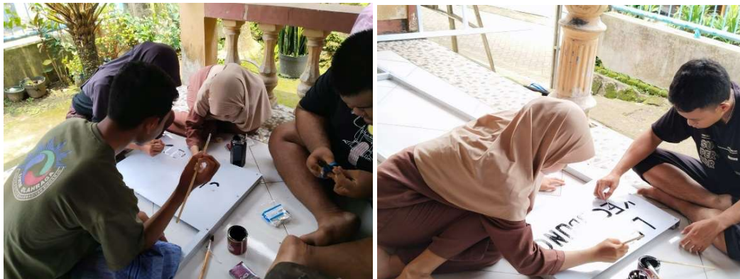
Gambar 3. Proses pembuatan dan pengecatan plakat petunjuk arah.

Kemudian kegiatan selanjutnya yang dilakukan Mahasiswa KKN-P Umsida Kelompok 31 adalah pembuatan plakat penunjuk arah Lembah Kecubung berupa plakat besi berwarna putih. Plakat ini akan dipasang di beberapa pertigaan dan perempatan, sehingga memudahkan pengunjung menemukan petunjuk arah menuju Lembah Kecubung. Dengan adanya plakat pengarah ini diharapkan dapat meningkatkan kemudahan akses dan memperkenalkan potensi wisata Lembah Kecubung kepada lebih banyak masyarakat.