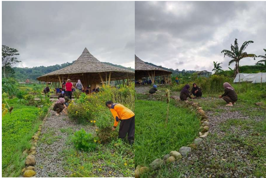
Gambar 2. Bersih - bersih lembah kecubung.

Lembah Kecubung. Hal ini bertujuan untuk menciptakan lingkungan yang bersih, nyaman dan ramah lingkungan bagi pengunjung dan masyarakat setempat. Selain itu, kegiatan ini juga merupakan bentuk kepedulian terhadap lingkungan dan upaya pelestarian alam berkelanjutan.