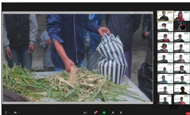
Gambar 2. Praktek proses pembuatan fermentasi pakan ternak.

rumput atau jerami padi, tanaman hijau, tong atau ember, plastik, tali karet. Langkah awal yang dilakukan pada proses pembuatan fermentasi pakan adalah menyiapkan bahan-bahan yang akan digunakan. Sebelum memulai ke langkah selanjutnya, tanaman hijau terlebih dahulu dikeringkan selama kurang lebih 3 jam. Setelah itu, mencampurkan EM4 dengan air yang disesuaikan dengan tempat penyimpanan (tong atau ember). Proses selanjutnya berupa pemberian EM4 sebagaimana disajikan pada Gambar 2.