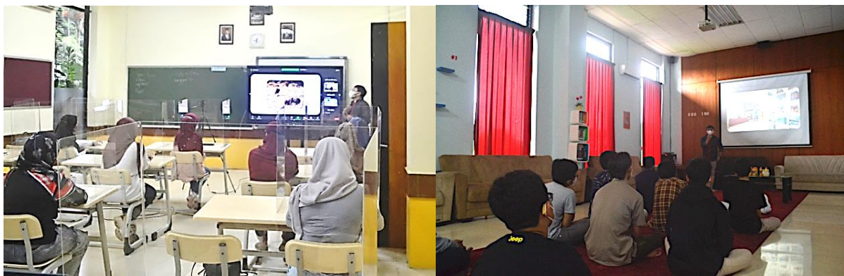
Gambar 5. Tim abdimas melakukan pelatihan untuk kelas putri dan kelas putra.

Tim abdimas menyusun materi dengan isi fotografi jurnalistik atau dokumentasi. Dalam tahap ini tim abdimas mempersiapkan materi dalam bentuk modul berupa powerpoint yang kemudian akan didistribusikan kepada siswa siswi Sekolah Pribadi Bandung. Materi powerpoint lebih menekankan untuk mengajak siswa siswi untuk bisa menghasilkan foto yang bercerita seperti halnya foto dalam dokumentasi. Tim abdimas menekankan bahwa foto yang bercerita dapat memunculkan ekspresi yang jauh lebih kuat pada penonton dikarenakan penonton dapat berimajinasi dan memberikan tanggapan terhadap foto yang dilihatnya. Tim abdimas pada materi PPT yang lebih banyak bercerita serta memberikan inspirasi kepada siswa siswi dengan harapan dapat menarik perhatian serta minat dari para siswa untuk bisa berpartisipasi dalam pelatihan dan sekaligus untuk mempromosikan program studi Seni Rupa Telkom University dengan peminatan film dan fotografi.