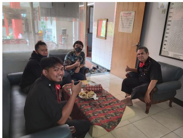
Gambar 1. Tim abdimas bersosialisasi mengenai kegiatan abdimas sebelumnya di SMP Telkom Bandung.

Sebelumnya untuk mendukung kegiatan dalam mengasah kreativitas para siswa-siswi, penulis membuat kegiatan abdimas di sekolah yang sama dengan judul pengkaryaan “Lokakarya Fotografi: Penggunaan Media Sosial Untuk Kreativitas Siswa di Masa Pandemi” dengan mitra SMP Telkom Bandung. Sekolah SMP Telkom mempunyai masalah yang sama dengan Sekolah Pribadi, yaitu adanya Batasan untuk mengasah kreativitas siswa dan menimbulkan ketertarikan mereka dalam membuat karya serta tetap terinspirasi.