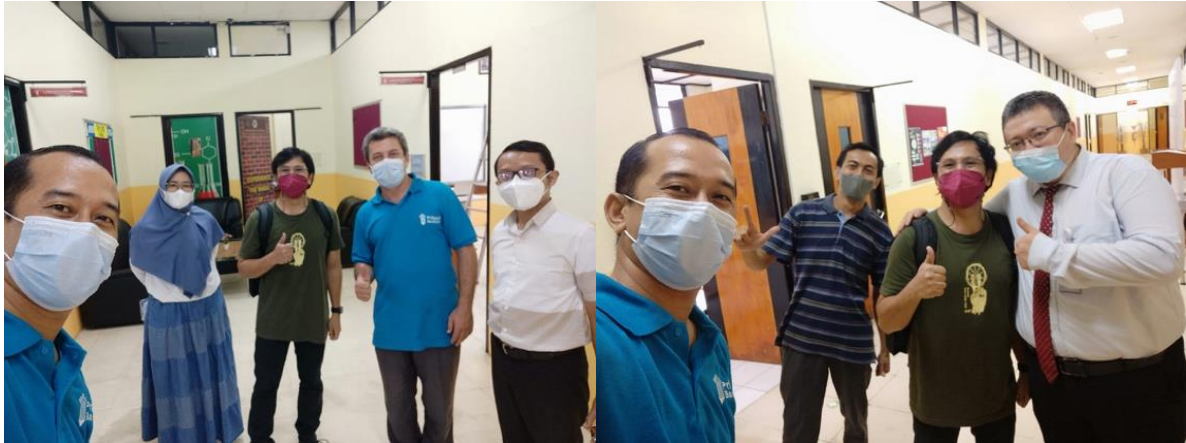
Gambar 3. Tim abdimas mengadakan pertemuan dengan guru sekolah pribadi bandung

Gagasan pelatihan ini membangkitkan minat para guru, karena tim abdimas ingin memperkenalkan anak-anak pada program seni dan bagaimana seni membantu pembelajaran kognitif dan emosional siswa. Anak-anak dapat membantu dengan pelatihan untuk menghasilkan informasi atau karya di media sosial yang dapat digunakan siswa untuk mempromosikan kegiatan sekolah mereka. Dengan demikian, diharapkan siswa dapat mempraktekkan hasil pelatihan di sekolah sebagai dokumentasi atau tim promosi selama kegiatan pelaksanaan, seperti jika kegiatan pembelajaran tatap muka dapat diulang.