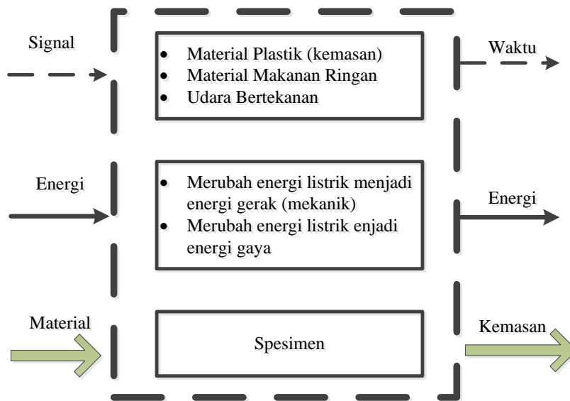
Gambar 1. Struktur fungsi