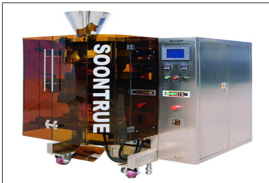
Gambar 2. Mesin Soontrue.

Mesin pengemas sachet atau mesin vertical packaging adalah sebuah mesin kemas yang sudah seharusnya tersedia di dalam sebuah industri. Mesin ini akan membantu efektifitas produksi di industri. Mesin vertical packaging [3] berfungsi untuk membantu mengisi kemasan sachet sekaligus menyegel atau menutupnya secara rapat. Mesin pengemas adalah alat yang dipakai untuk pengemasan berbagai hasil produksi, baik berupa makanan seperti kopi, keripik, snack, gula pasir, beras, minyak goreng, tepung [4].