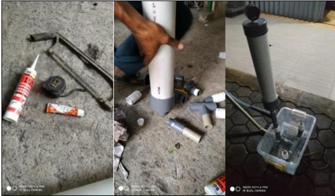
Gambar 4. Proses Pembuatan

Proses dan Waktu Produksi Pemasangan Pompa dan Sambungannya (Siahaan & Sitepu, 2013), sebagai berikut: